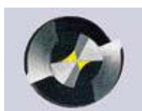
Rádiusový výbrus příčného ostří