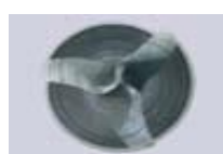
Hertel - TF