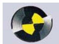
Standardní křížový výbrus příčného ostří