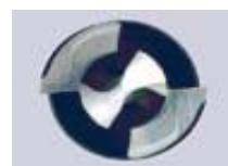
Standardní výbrus s kuželovým pláštěm a rádiusovou špičkou