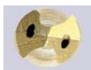
Klenk + Seco + Gühring