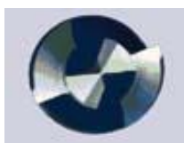
Standardní dvoufazetkový výbrus Křížová geometrie špičky

Umíme pro vás naostřit níže uvedené originální geometrie vrtáků renomovaných výrobců. Rozhodněte se sami, jaký typ geometrie si přejete. Samozřejmě vám můžeme nabrousit i další geometrie podle dodaného vzoru nebo podle návodu na ostření (Schleifanleitung).